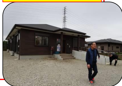
昨年、八街コスモス見学会